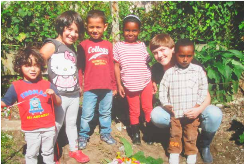
Une photo de l'exposition de photos