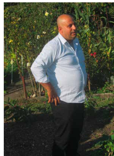
Mustafa Veli de Turquie