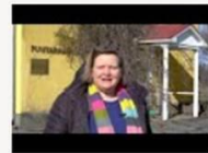
Den skräddarsydda kursen för kolonister