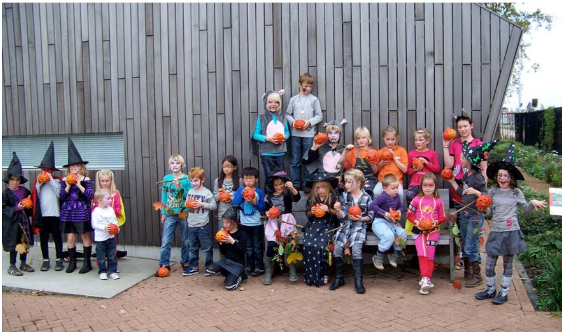
(Teil der Hexen, der kleinen Teufel und der Draculas)

Der AVVN hat für die Kinder von Utrecht eine Halloween Party organisiert. Die Kinder haben, mit der Hilfe ihrer Eltern, wunderschöne Halloweenengesichter aus Kürbissen gemacht. Sie haben auch Herbstdekorationen mit Blättern und Früchten hergestellt. Sie konnten desweiteren ihre Gesichter schminken lassen. Nach diesen Aktivitäten gingen viele Hexen, kleine Teufel und Draculas mit ihren wunderschönen Laternen und Herbstdekorationen nach Hause.