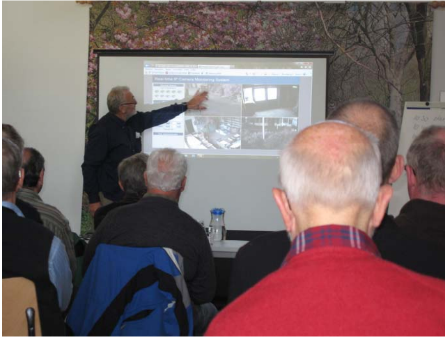
(Eine der Vorführungen)