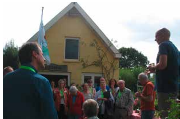
Besichtigung von Kleingärten