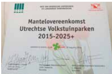
Schutz der Kleingärten in Utrecht