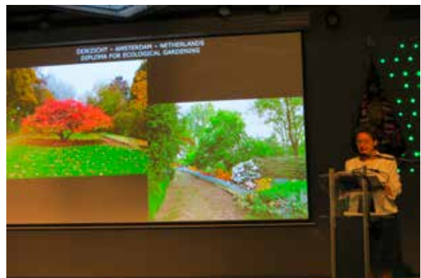
Verleihung der Ehrenurkunden