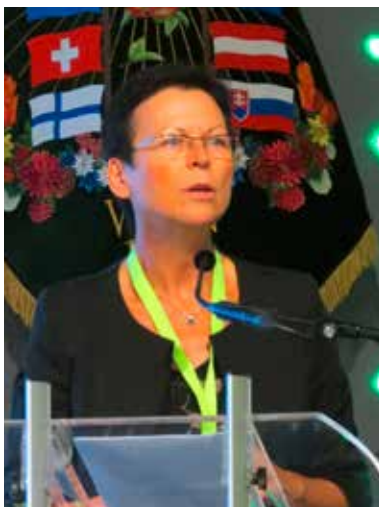
Vortrag von R. FOX-KÄMPER über das Cost Projekt