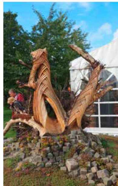
Statue als Erinnerung an den 37. Internationalen Kongress und den Europäischen Tag des Gartens 2014