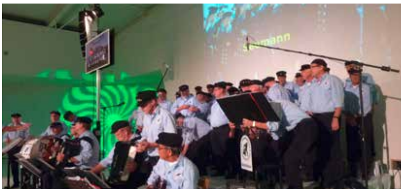
Abschlussdinner mit den Ijssellmannen