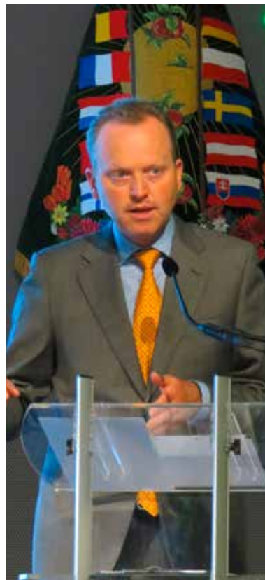
Ansprache des Vertreters der Landwirtschaftsministerin