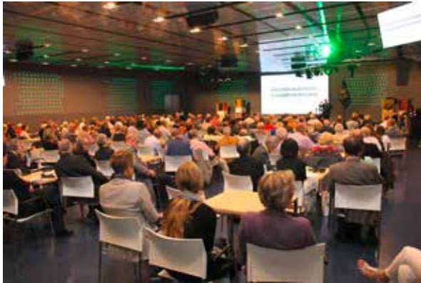
Die Delegierten bei der Arbeit