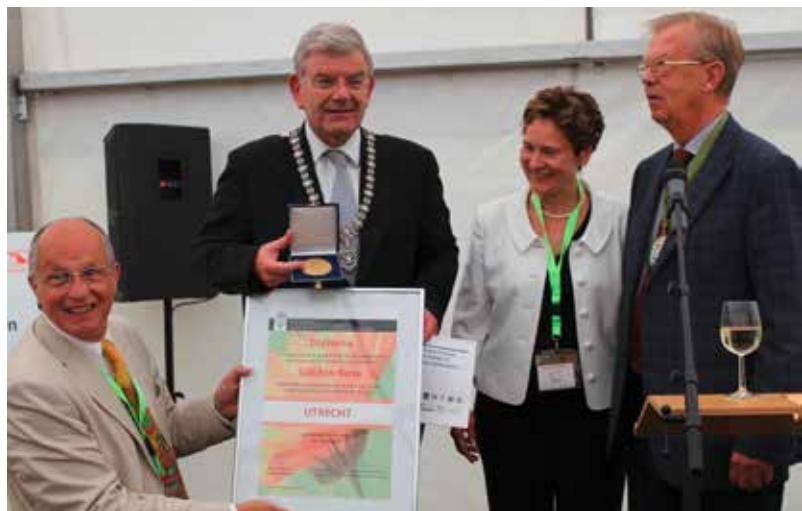
Verleihung der Goldenen Rose an die Stadt Utrecht