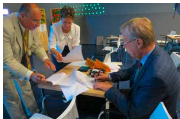
Unterzeichnung der Resolution