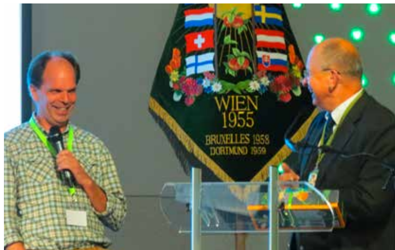
Vortrag von K. KOSSE zum Thema Bienen