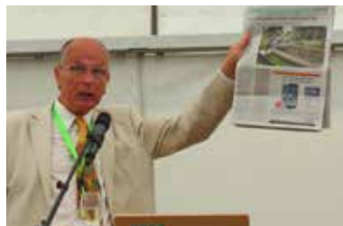
Kleingärten in den Medien