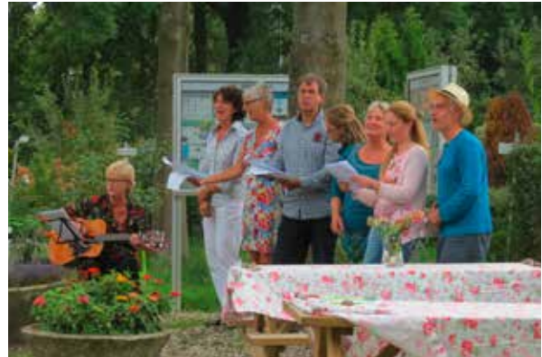
Empfang in den Kleingärten