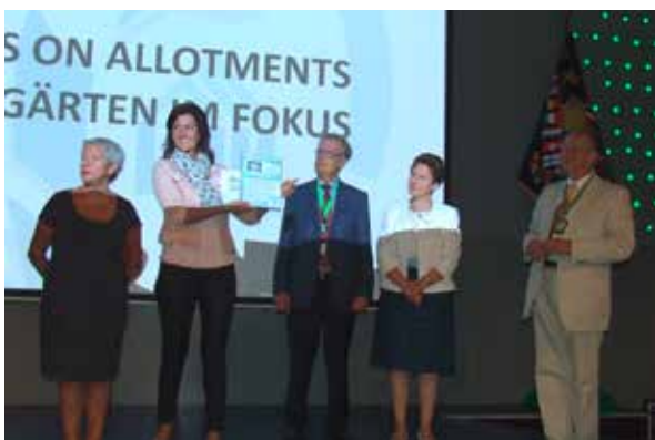
Verleihung der Ehrenurkunden