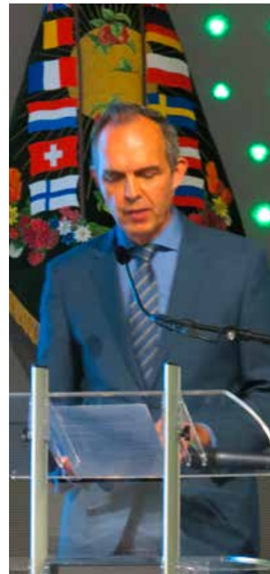
Ansprache des Vertreters der Stadt Utrecht