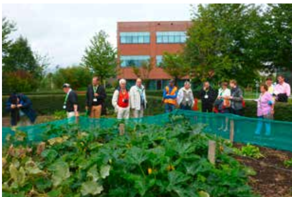
Besichtigung von Kleingärten