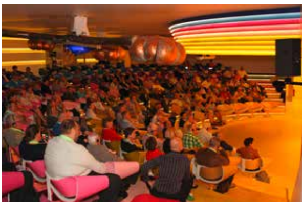
Die Delegierten bei der Arbeit